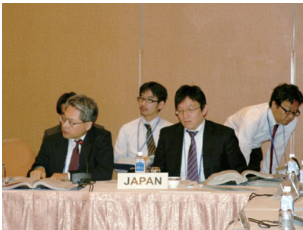
同会合においてiPACイニシアチブを提案する大町国際課地域政策室長（前列左側）